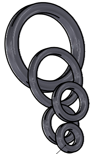
108013 - Quadring-Satz zum Austausch aller Quadringe im Stativ